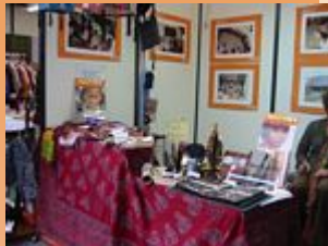
Fira de la Mercè, setembre 2005